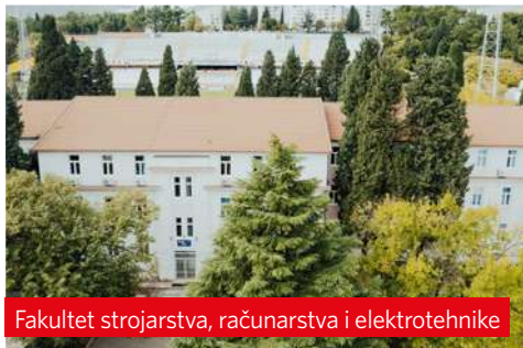
Fakultet strojarstva, računarstva i elektrotehnike