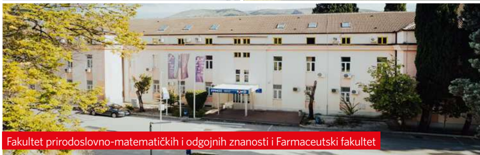
Fakultet prirodoslovno-matematičkih i odgojnih znanosti i Farmaceutski fakultet