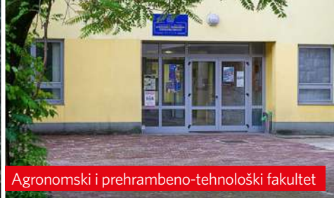
Agronomski i prehrambeno-tehnološki fakultet