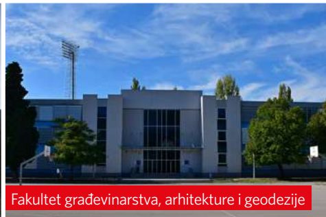
Fakultet građevinarstva, arhitekture i geodezije