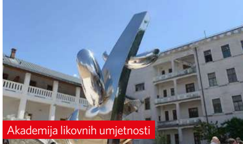
Akademija likovnih umjetnosti