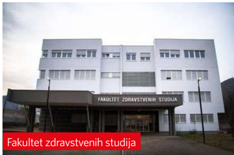
Fakultet zdravstvenih studija